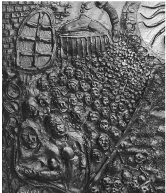
تابلۆی هونه رمنده «نازاد نه نوهر»

هه ر چۆنیک بیت «خۆریکی ره شپۆش» هه ولتیککی جیددیبه له ره وته شیوه کاریمان، ده کربت و توویژ و دیالوگی زیاتر به دوا ی خۆیدا به هیتیت.