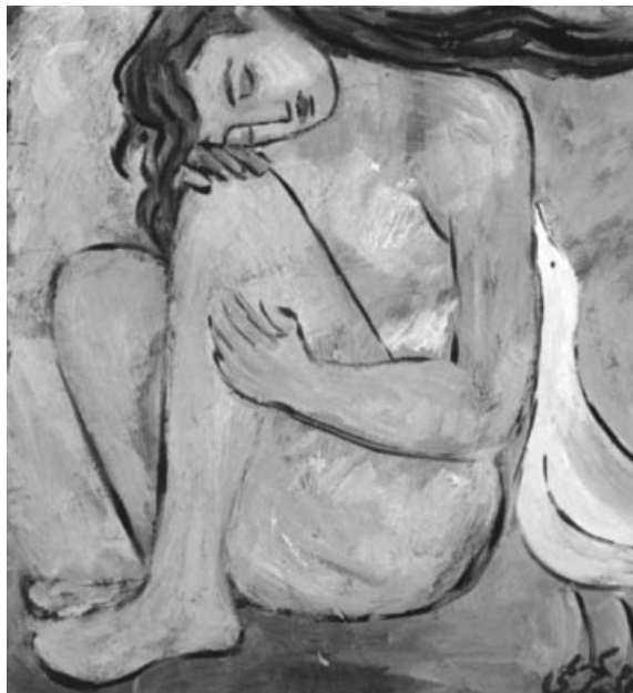
تابلوی هونرمه‌ند «نه‌کره‌م که‌رمی»

جۆراوجۆره‌کانی تری کۆمه‌لگه ئی‌حای ژیان و فۆرمی کارکردنی له‌وانه‌وه وهرده‌گرن، ئی‌دی ئەمه ده‌بیته به‌که‌م خالی له‌ ده‌ستدانی یاده‌وه‌ری جه‌معی له‌ کۆمه‌لگه‌ی ئی‌مه‌دا.