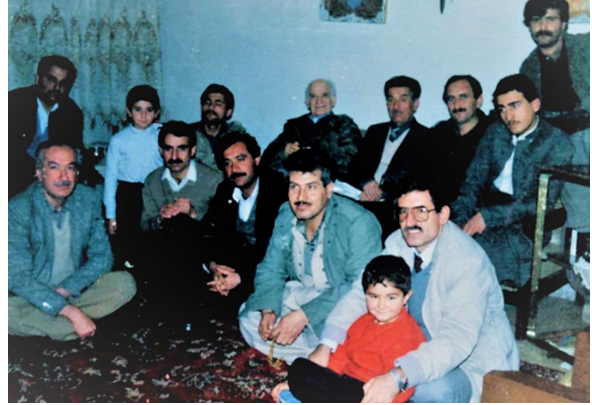
له دیداریکی کۆمهلهی فۆلكلۆر و كهلهپوری كوردیدا

(گلهپیهکی لهو کۆنگره سههرکهوتوووه میژوویی و پر بایه خداریه نه بوو!) به هیوام ئه و دیداره چاپ بکهه - هه چهنده ئه وهی جیگهی داخه من (۳۵) پرسسیارم ئاماده کردبوو، به هۆی ئه وهی دروستیی ئه و باش نه بوو من توانیم چهنه پرسسیاریکی که می لی بکهه، ئه و نهیتوانی. بریارمان دا له هاتنه وهیه کی تردا ته وای بکهه بن. زۆر به داخه وه به جیی هیشتین (یادی به خیر) بو من بوو به داخیکی گه وه.