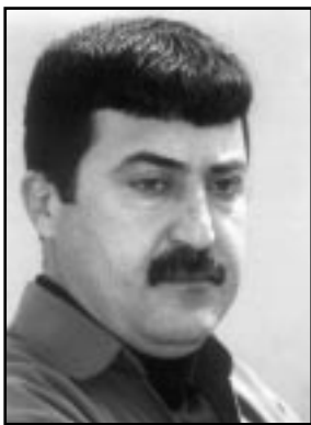
ژیلوان تاهیر باپیر (*)

بەشیوەیەك بوو كە نەدەتوانرا هێلە درامییەكان ئاشكرابیت. لەم سەردەمەدا شانۆییەكان گەشتوونەتە پلەبەك كە ئالۆزو پر گری بن. شانۆییەكانى یونسكو و پىكیت و ئاداموف و جینی لەو جۆرە شانۆكارانەن كە بەرھەمەكانیان لەو جۆرەن كە ئالۆزی و تەم و مژییەكى تیا دادەبەنرێ. بىنینی ئەو جۆرە شانۆییانە بەمەرجیكى سەرەكى دادەنریت كە پێویستە ھەموو مەرجیكى ھاوچەرخ سەیری بكات، لەراستیدا ھەموو ئەو شانۆییانە كە لەچوارچێوەى شانۆی ئەزمونگەرى و پێشپەرەدا دەرکەوتوو كە لەبەر تێكى ھاوبەشەو ھەلقولان، كە یەكێكە لەبەر و بۆ چوونەكانى ئارتۆ.