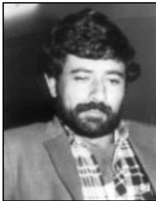
غازى غه فوور

هەر شانۆگه ر بيه ك بودجه كى به زووى بى بدرىت و رهت نه كرىته وه. پىويسته شانۆكاران له ناوخويان كوڤنگه ريه ك بيه ستان تايزان بۆ شانۆ له هه ولير و اى به سه رها ت؟ چى پىويسته بۆ زىنده و كورده وهى؟ هونه ر مه ندانى شانۆ پىكه وه كار بكه ن به جىاوازى بىرو رايان. هه ولدان بۆ