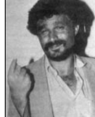
موئه یه ده فقه ی

موئه یه ده فقه ی: هه ولیتر شاریکی پر ئەزمونه، کولتوری نه ته وه ئایینه کۆنه کانی سه رده می خۆی بووه، به للام هه موو کات هه سته نه ته وایه تییه که ی فه رامۆش کراوه، ئیستا ش دوو چاری پاشماوه ی کولتوره کۆنه که یه و خۆی خۆی ده خوانه وه. که ده لپین هه ولیتر، ده بی نکۆلی له تازیانه تی و دل سوژی و وه فاداری ئەم شاره نه که ین، هه ولیتر هه رگیز دوور نه بووه له ته ده ب و رۆشنییری و دراما و شانۆ. ئەگه ئاو رپیک له میژووی ئەم شاره بده ینه وه، ده بینن هه رده م حه زی له یاراستنی مۆرکی نه ته وه یی