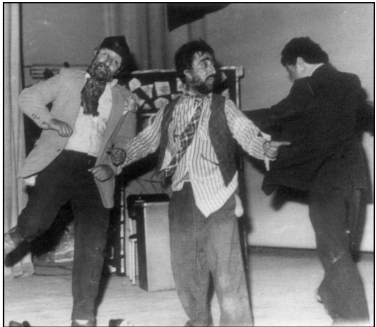
شانۆگەری «مرۆف و نازارەکانی» دەرھێنانی سەباح عەبدولپەرھمان - ۱۹۸۱

دوو شیوازی چارەسەکردن کە لەدووگیان و روحیەتی جیاوازی هەلقوللان، کەواتە ئەگەر شاکاریکی وەک مەم و زین بە لیکۆلینەوه و دوور لە شێواندن بکەیتە پرۆژە ی تیکستیکی شانۆیی، پێم وایە لە هەر مۆزەخانەیک بیت لەجیھان لە غەیری ناسنامە ی کوردی، هیچ ناوینشانیکی تر وەرناگری.. ئەمە و جگە لەو هەموو بەسەرھاتانە ی کە کوردی گرتۆتەوه و هاوشیوەشی نییە وەک مەرگەساتی هەلەبجەو کیمیا باران و ئەنفالەکان کە یەک پارچە هەمووی کەرستە ی دراماتیکی و دەکرێنە دەیان تیکستی شانۆیی سەر سوپھینەر کە شایەنی ناسنامە ی کوردی بێ و بەدەقی کوردی بخوێندرێنەوه و ژبانی سەدان شاعیر و بلیمەت و شۆرشگێڕ و هزر مەند و هونەر مەندی گەورە ی ئەم میللەتە کە پرن لەبەسەرھات و کە لە پووڕو دابونەرتی بەھادار کە جۆریک لەسیستەمی ژبانی کوردەواری دەخاتەر و دەیکاتە هێلی درامی ئەو میللەتە و سەدان شیوە ی جلویەرگ و پۆشاک و