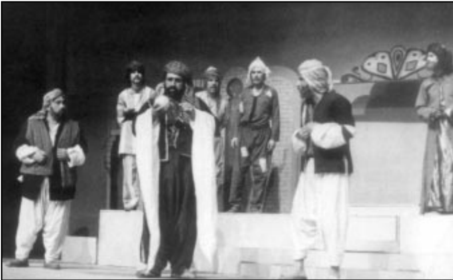
شانۆگەری «هەبوو نەبوو» دەرھێنانی سەباح عەبدولرەحمان - ۱۹۸۱

بەدڵسۆزییەو خۆیان بە بەشیکێ ئەم سیستەمە داناو و پەرۆش بووینە بۆ قوربانیان لە پینا و خاک و نیشتیما و بە پیتی پرنسیبی رژیم و بەهەموو راستگۆییە کەووە کاریان لەسەر ئەو کەردوووە کە گەورەیی و سەرورەری ولات و دیموکراسییەت بکەنە درووشم لە نووسینەکانیاندا، ئەوەتا سۆفۆکلیس لە شانۆنامەی «ئۆدیبۆس» لە کۆلۆتۆس» بەو پەڕی ئەفراندنەو ئەو گەرکە وەسف دەکات بە جوانی کە تێدا لەدایک بوو وەک نیشانە یەک بۆ خۆبەستنەو بەخۆشەویستی خاک و نیشتمان و ئینتیما نەتەوێی.