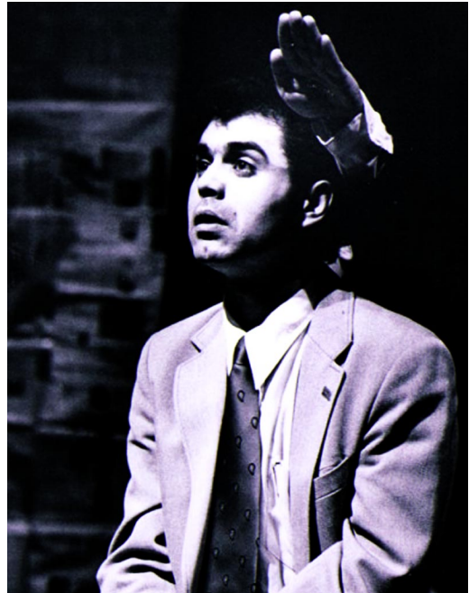
کوردد گه لالی له دیمه نیکي شانۆی «پروتیبونوه»

کونکریتتره، هه رچی دوو که سایه تیبیه که ی ناو پروتیبونوه و ده یه، دوو که سی نادیارن، نازانین کین، نه ونده نه بیت، که وه کو زۆریه که سایه تیبیه کانی مرۆژتیک یه کیتکیان پروونا کبیره، نه وه ی دیکه یان ساده یه. به سه رهایی هه ردوو که سایه تیبیه که له پانتایی پرووبه رتیکی نادیاردا پروو ده دن، فه زایه که که سیما و سنووره کانی ده ستنیشان نا کرین، نه م دوو که سایه تیبیه به A و B، ناویان ده بات، هه ردوو کیان به پروالته له دوو بزنیسمان ده چن، هه ردوو قات له بهر و شیکن، جانتای دیپلۆماسییان پییه، به لام پاشتر بۆمان پروون ده بیتته وه که A له B پیچه که رۆشنیبرتره.