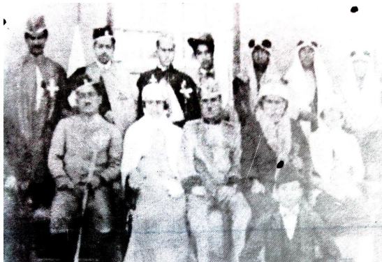
شانۆگەری «سەلاحەددین ئەبووبی»، سالی ۱۹۳۰

مردوووەکە دەگەریتەوه. نۆتیل لە بابەتی نەریته کۆمەڵایەتییەکانی عەشیرەتی (بەرازی) لە (سبیرک) ناوچە (ئورفا) دەلیت: